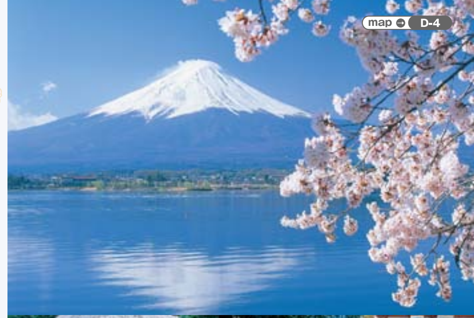
map ⇨ D-4