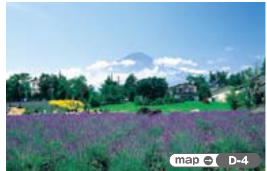
map ⇨ D-4

富士河口湖町 河口湖ハーブフェスティバル ラベンダーの香りいっぱい初夏の湖 雪解けた富士山をバックに湖畔を紫色にうめつくすラベンダーの絨毯は、河口湖に初夏を告げる景色。ラベンダーの香りが一面に漂う湖畔では、湖畔公園を中心にハーブにまつわる様々なイベントを盛大に開催。ライトアップされる夜もロマンチックです。 ●富士河口湖町・八木崎公園・大石公園 ●6月18日(金)～7月11日(日) ●無料 ●富士急行線河口湖駅から八木崎公園へはバス約10分、中央自動車道河口湖ICから車10分、大石公園へはバス約30分、中央自動車道河口湖ICから車20分 ●富士河口湖町観光課 ☎0555-72-3168