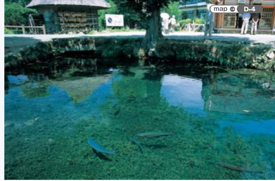
map ⇨ D-4