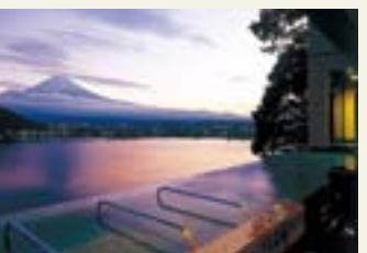
富士河口湖温泉郷(富士河口湖町)