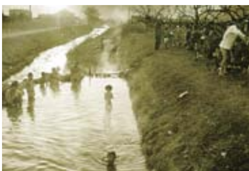
石和温泉の事始め(昭和36年1月)

梨には昔から数多くの温泉があったのではと思われがちですが、1895(明治28)年発行の『甲斐名湯案内誌』によれば、山梨県の8カ所ある25度以上の温泉のうち、富士川支流早川溪谷の西山温泉、峡南下部川溪谷の下部温泉、笛吹川溪谷の川浦温泉、塩ノ山山麓の塩山温泉、湯村山山麓の湯村温泉の5カ所が紹介されているだけでした。その後ラジウム含有量が世界といわれる増富温泉が世に出され、さらに1961年に石和町(現・笛吹市)で、ぶどう畑から高温の湯が湧き出しました。この石和温泉、春日居温泉の誕生が、山梨の温泉県としての幕開けとなりました。