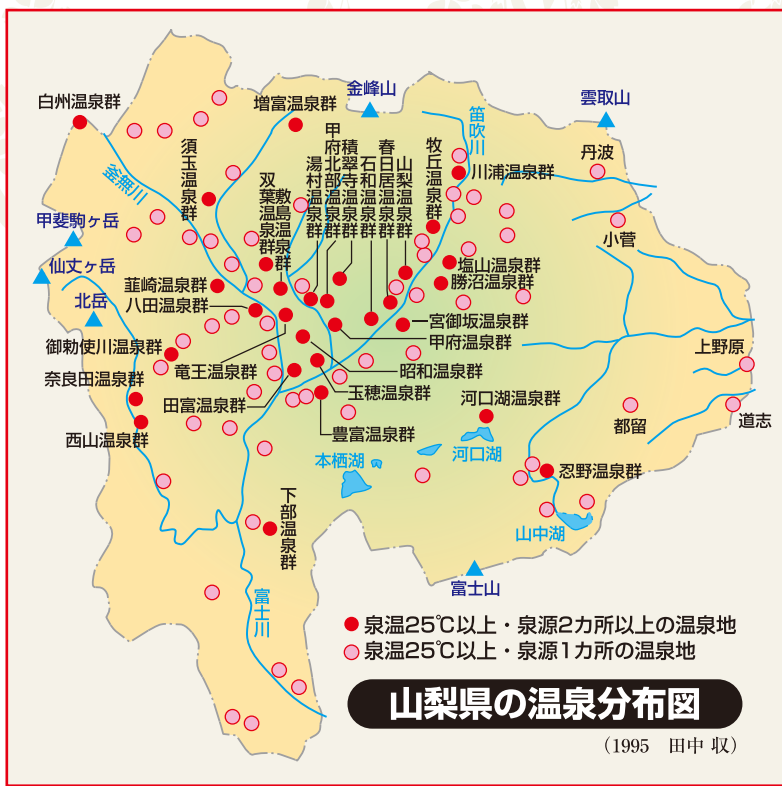
山梨県の温泉分布図 (1995 田中 収)

● 泉温25℃以上・泉源2カ所以上の温泉地 ○ 泉温25℃以上・泉源1カ所の温泉地