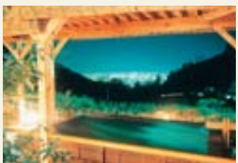
積翠寺温泉(甲府市)