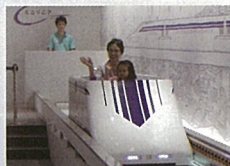
2F▶磁気浮上走行が体験できるミニリニア