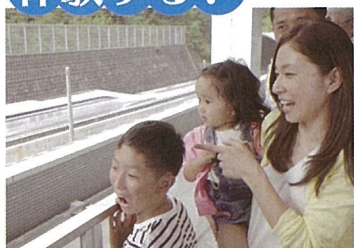
2F▶実験線の走行を間近で見られる屋外見学テラス ※リニア走行試験が行われない日もあります。 試験の日程は館内案内の他リニア見学センターホームページにてご確認ください。