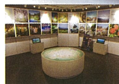
2F▶わくわくやまなし館