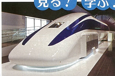
1F▶時速 581 km を記録した実車両を展示