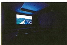
3F▶時速 500 km の感覚を得られるリニアシアター