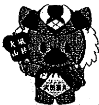
「武田菱丸(ひし丸くん)」