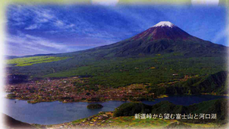
新道峠から望む富士山と河口湖

すずらんの里散策バスツアー 芦川すずらん群生地や町並散歩、郷土料理が楽しめるバスツアーを開催します。