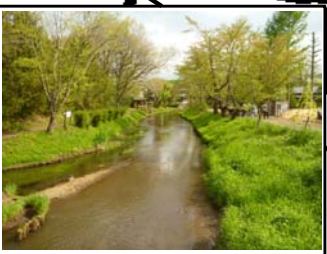
＜新名庄川＞ 豊かな水がゆらゆらと流れる新名庄川。のんびりてくてく歩いても、気持ちがいいです。