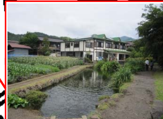
＜菖蒲池＞ 世界文化遺産の忍野八海の1つ。