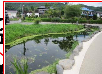
＜鏡池＞ 世界文化遺産の忍野八海の1つ。