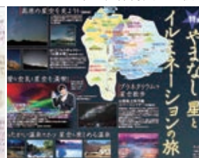
(写真5・6) 高校生が作った星めぐりマップとそのアイデアを元に観光推進機構が作ったガイドブック