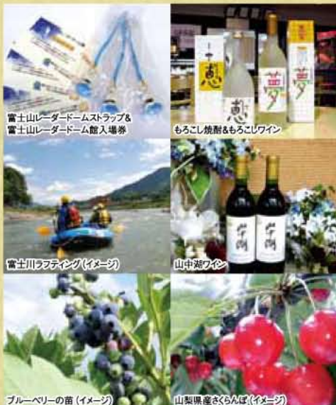
富士山レーダードームストラップ&富士山レーダードーム館入場券