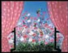
「コスモスとこびと」藤城 清治