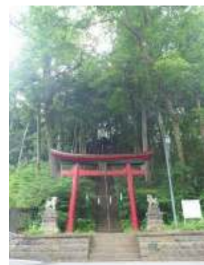
境内までは約100段の階段が

樹型散策のついでにお参りも、という方は近くに「魔王天神社」という神社もあるので、立ち寄ってみてはいかがでしょうか。