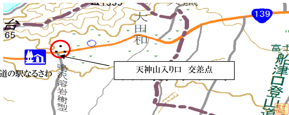
カシミール使用 赤丸は鳴沢溶岩樹型の位置