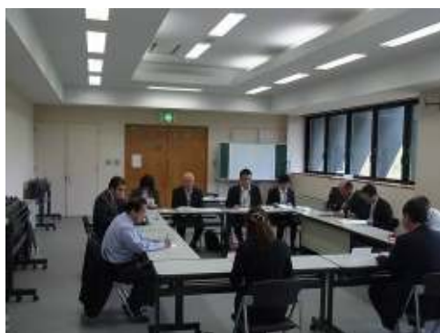
富士山憲章山梨県推進会議 幹事会のメンバー

富士山ボランティアセンターは富士スバルラインの入口にある富士山ボランティアセンター内に事務所があります。富士山環境保全に興味がある方は是非お立ち寄りください。