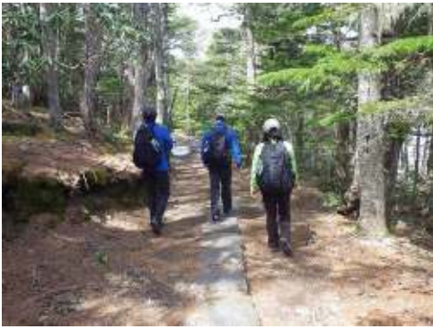
富士山五合目御中道を巡回する 富士山レンジャー

富士山レンジャーは富士山のパトロールだけではなく、いろいろなキャンペーンやイベントでマナーの啓発と普及に努めています。みなさまのご協力をお願いいたします。