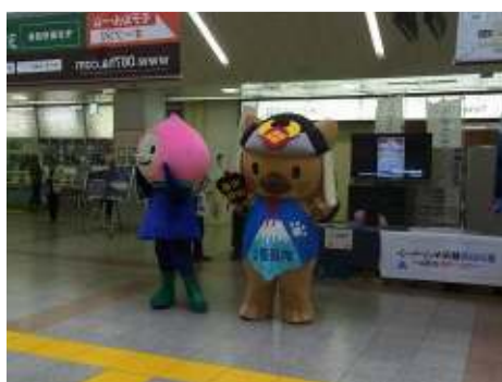
八王子キャンペーンに登場した おなじみの菱丸

富士山レンジャーは富士山環境保全活動の一環として、巡回活動の中で撮影した写真を展示しました。富士山の中腹から撮影した雲海の写真は多くの通行客の目を引いていました。富士山の美しい写真とともに、夏の登山シーズンに夜間の登山道が渋滞している様子を撮影した写真も展示されました。展示を見ていた通行客のひとりには富士山がこんなに渋滞していることにとってもびっくりしているように見えました。真つ暗な登山道の中でヘッドライト一つだけで登山する様子を写した写真は、弾丸登山の危険性を示すよい材料になったようです。