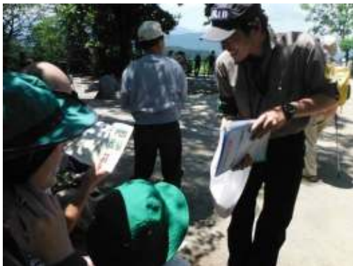
高尾山にて富士山の登り方や注意点と保全協力金の説明する富士山レンジャー

6月14日と28日の二日間にかけて、東京都の高尾山にて登山客らに富士山での安全登山と富士山保全協力金の周知と啓発のためキャンペーンを行いました。高尾山は登山の入門として大変人気の高い山であるとともに、今年富士登山を目指す方の練習の山としても大変多くの方がいらつしゃいます。この日もたくさんの方から今夏の富士山を目指しているというお話を聞き、弾丸登山の危険性や保全協力金の説明とお断りをさせていただきました。皆さん非常に自然に対する意識が高く、私たち富士山レンジャーも驚かされました。とても有意義なキャンペーンとなりました。