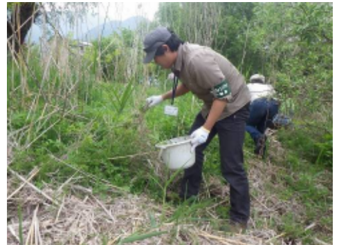
左写真 発芽したアレチウリ 右写真 手で一本一本抜いていく