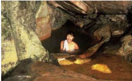
JR中央本線須崎駅→バス約50分 / 中央自動車道 須玉IC→約30分 0551-45-0600(増富ラジウム温泉峡観光案内所)

ラジウム含有量が世界一ともいわれ、戦国時代には武田信玄公の隠し湯として、現在では山の湯治場として人気を集めています。増富の湯では、源泉入浴、森林浴散策、野菜料理などをセットにした一日保養プランも行われています。