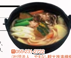
055-231-2722 (社団法人 やまなし観光推進機構)

武田信玄公の陣中食と伝わる山梨の郷土料理で、甲府市内をはじめ山梨県内各所に専門店があり、一般の食堂のメニューにも多い。