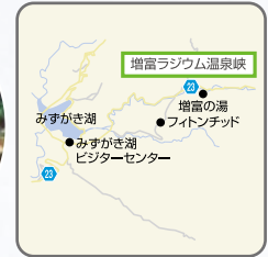
JR中央本線須崎駅→バス約50分 / 中央自動車道 須玉IC→約30分 0551-45-0600(増富ラジウム温泉峡観光案内所)