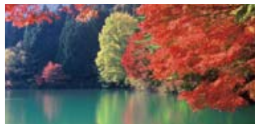
四尾連湖畔(市川三郷町)

富士川に沿って紅葉の見所がいくつも点在。竜の伝説を持つ標高850メートルの山上湖・四尾連湖、滝や吊り橋の変化に富んだ早川渓谷、身延山ロープウェイなど、様々な山梨の大自然を満喫しましょう。