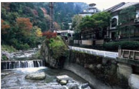
JR身延線下部温泉駅→徒歩約10分 / 中部横断自動車道 増穂IC→約30分 0556-20-3001(下部観光協会)

武田信玄公が合戦で受けた傷をここで癒したとして伝わる名湯。古来より変わらぬその優れた泉質と歴史を感じさせる温泉情緒が残り、多くの温泉ファンを惹き付けています。