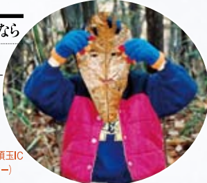
JR中央本線須崎駅→バス約50分 / 中央自動車道 須玉IC→約30分 0551-45-0081(みずがき湖ビジターセンター)

藍染め、草木染め、フェルト、木工、押し花など、作る教室の他、遊びの教室もあり、大人も子どもも体験三昧できます。