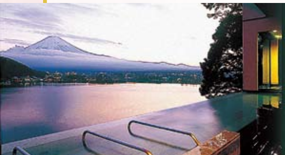
富士急行線河口湖駅→バス約5分 / 中央自動車道 河口湖IC→約10分 0555-72-3168(富士河口湖町観光課・観光連盟) 0555-72-2460(河口湖観光協会)

富士山のふもと河口湖周辺に5つの源泉が湧出。富士山の勇姿を望めるお風呂も多くあり、露天風呂から富士山や河口湖の姿が見えた時の感動は、きっと忘れられないでしょう。