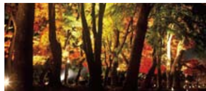
河口湖もみじ回廊(富士河口湖町)