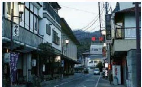
JR中央本線甲府駅→バス約15分 / 中央自動車道 甲府昭和IC → 約15分 055-252-2261 (湯村温泉旅館協同組合)

1200年前、弘法大師の開湯として伝わる歴史のある温泉で、信玄の隠し湯としても知られています。太宰治、井伏鱒二、松本清張などの執筆の宿も多く、今も良質で高温、無色透明の温泉が湧き出しています。