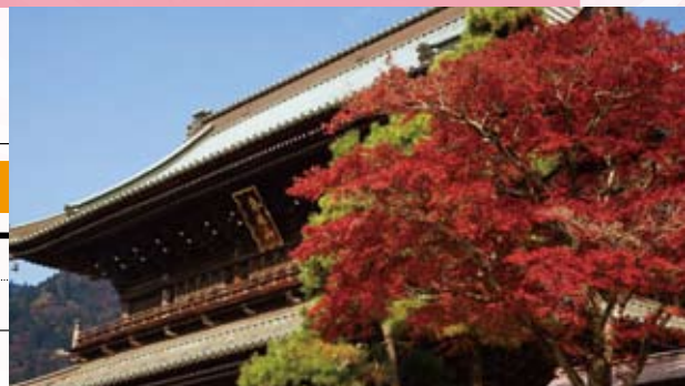
JR身延線身延駅→バス約10分 / 中部横断自動車道 増穂IC→約40分 0556-62-0502(身延山観光協会)