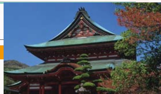
大人500円、小学生250円 9:00~16:30 無休 JR身延線善光寺駅→徒歩約7分 / 中央自動車道 一宮御坂IC → 約20分 055-233-7570