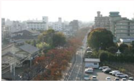
JR中央本線石和温泉駅下車 / 中央自動車道 一宮御坂IC → 約10分 055-262-3626 (石和温泉旅館協同組合)

1961年に石和のぶどう園から高温の温泉が湧き出してから発展し、全国屈指の温泉郷になりました。9つの宿では温泉入浴指導員(温泉コンシェルジュ)が常駐し、各個人にあった入浴方法や健康作りのアドバイスをしています。