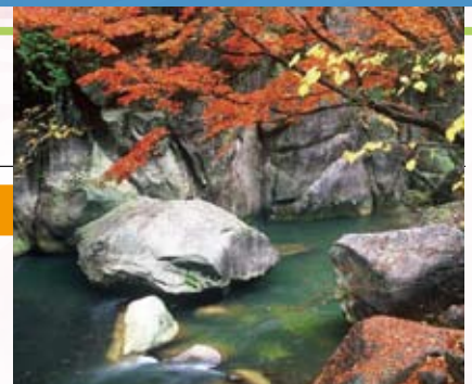
JR中央本線甲府駅→バス約30分 / 中央自動車道 甲府昭和IC → 約30分 055-287-2121 (昇仙峡観光協会)