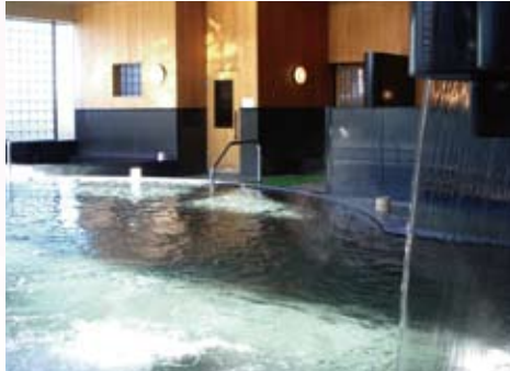
JR中央本線春日居駅→徒歩約15分 / 中央自動車道 一宮御坂IC→約15分

石和温泉郷の北東に位置し、桃の産地として名高い春日居。果樹園地帯の中にある静かな温泉地で、のどかな風景とともに、秋には旬の味、ぶどうも楽しむことができます。