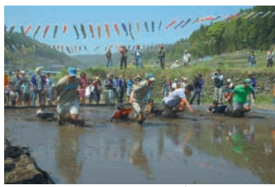
長沢こいのぼり祭り(北杜市)

【北杜市】 棚田の上に約500匹の鯉のぼりを飾り、子どもたちの元気な成長を祈願。どろんこ大会、餅つき大会など、親子で楽しめます。 ☎道の駅南きよさと ☎JR中央線長坂駅 バス20分/須玉I.C. 15分 ☎北杜市高根総合支所 0551-42-1441