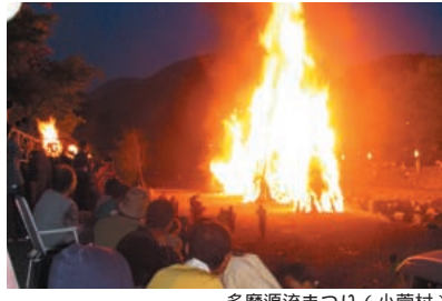
多摩源流まつり(小菅村)

【小菅村】 「水」がとりもつ緑を大切に育み、「火」にかけた願いの実現を誓い、「味」で故郷をしのぶ祭り。ニジマスつかみどりもあります。 ☎小菅村民スポーツ広場 ☎JR青梅線奥多摩駅 バス50分/上野原I.C. 50分 ☎小菅村源流振興課 0428-87-0111