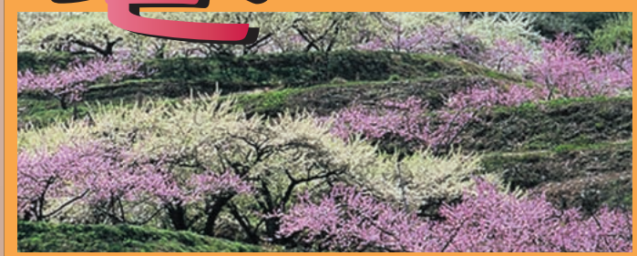
スモモと桃(笛吹市)

座席数・台数の都合上、必ずしもご希望の時刻のバスをご利用できない場合がございます。お急ぎの場合はタクシーなど他の交通手段をご利用ください。石和温泉旅館協同組合加盟のホテル・旅館にご宿泊の方には、タクシーの割引サービスもございます。 ☎笛吹市観光商工課 055-262-4111