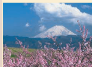
桃の花と富士山(南アルプス市)

桃の産地・山梨の春は、桃の花がいつせいに開花し、薄紅の世界が広がります。峡東桃源郷、南アルプス桃源郷、新府桃源郷など、随所に見どころスポットが。天気に恵まれると、花露の向こうに雪嶺の山々を一望できます。