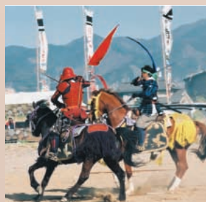
川中島合戦戦国絵巻 (笛吹市)

新府城跡 JR中央線新府駅 徒歩10分 / 韮崎I.C. 15分 韮崎市観光協会0551-22-1111