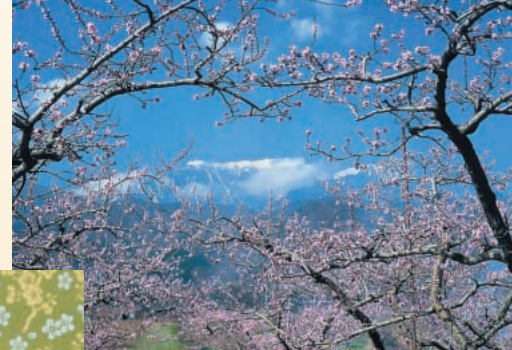
韮崎新府の桃(韮崎市)