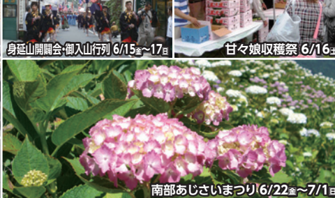
南部あじさいまつり 6/22 金 ～7/1 日