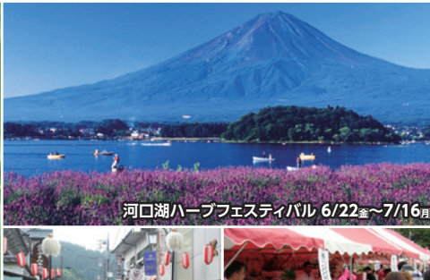
河口湖ハーブフェスティバル 6/22 金 ～7/16 日 身延山開闢会・御入山行列 6/15 金 ～17 日 甘々娘収穫祭 6/16 土