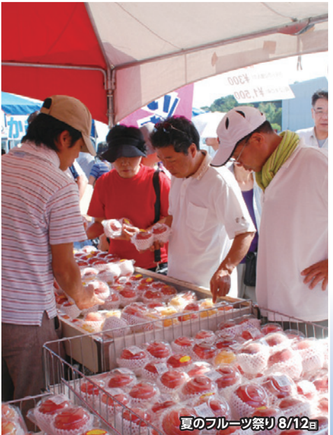
夏のフルーツ祭り 8/12 日