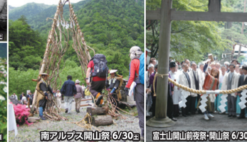
南アルプス開山祭 6/30 土 富士山開山前夜祭・開山祭 6/30 土 ～7/1 日