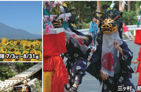
三ヶ村 箭弓神社祭典 8/4 土