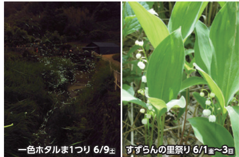
一色ホテルまつり 6/9 土 すずらんの里祭り 6/1 金 ～3 日

【小管村】 小永田地区 熊野神社祭典 小管村無形文化財になっている神代神楽が奉納される、小永田地区の祭典。 昼間:宮巡り 夜:祭典 熊野神社(小永田地区)及び周辺 ☎圏央道青梅ICから車約70分、中央自動車道上野原ICから車約45分 JR青梅線奥多摩駅から西東京バス「小管行き」約50分 小管村役場源流振興課 ☎0428-87-0111