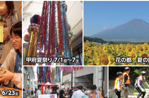
甲府夏祭り 7/1 日 ～7 土 花の都 夏の陣 7/3 火 ～8/31 土