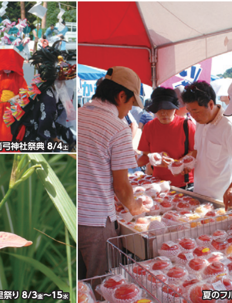
ヒオウギの里祭り 8/3 金 ～15 水