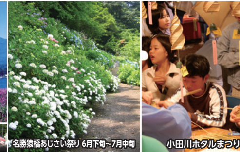
名勝猿橋あじさい祭り 6月下旬～7月中旬 小田川ホテルまつり 6/23 土