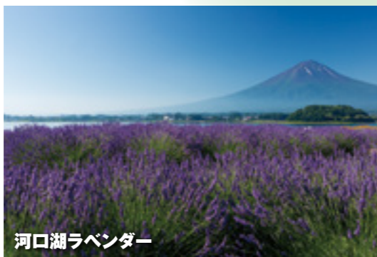
河口湖ラベンダー

場所 ▶八木崎公園(メイン会場)、大石公園 問合せ ▶富士河口湖町観光課 ☎0555-72-3168 ★ラベンダー観賞。ステージイベント(八木崎公園毎土日) 羽生市観光経済交流コーナー(八木崎公園6/25、7/2) (電車)富士急行線河口湖駅→周遊バス10分 (車)中央道河口湖IC→10分(メイン会場)