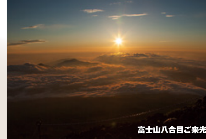
富士山八合目ご来光