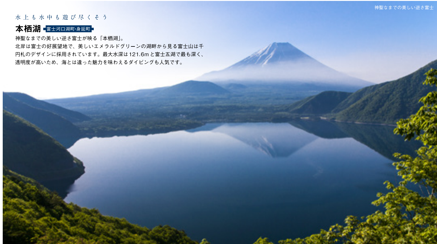
神聖なまでの美しい逆さ富士

山梨は雄大な自然がつくる芸術的な渓谷や、美しい景色に出会える名水パラダイス、綺麗な景色を楽しみ、水とふれあい、山梨の夏を満喫してみませんか？