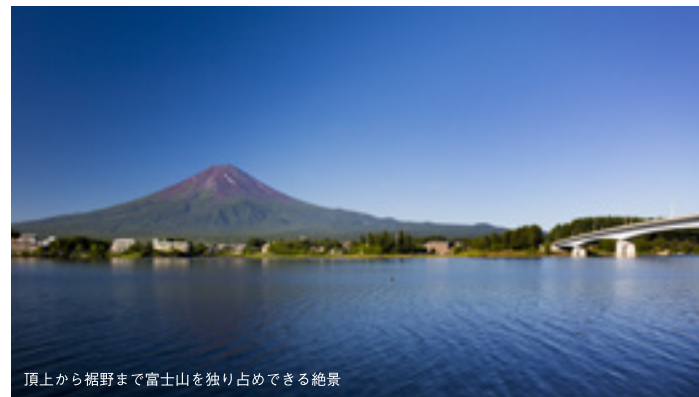
頂上から裾野まで富士山を独り占めできる絶景

約70年ぶりのクニマスの再発見で話題となった西湖は、山梨県指定天然記念物フジマリモの群落地でもあります。青木ヶ原樹海と連なり貴重な自然資源が豊富に存在します。近くの富岳風穴は中に入ると夏でもひんやり涼しく人気のスポットです。