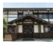
2017 ルバイヤート甲州シュール・リール