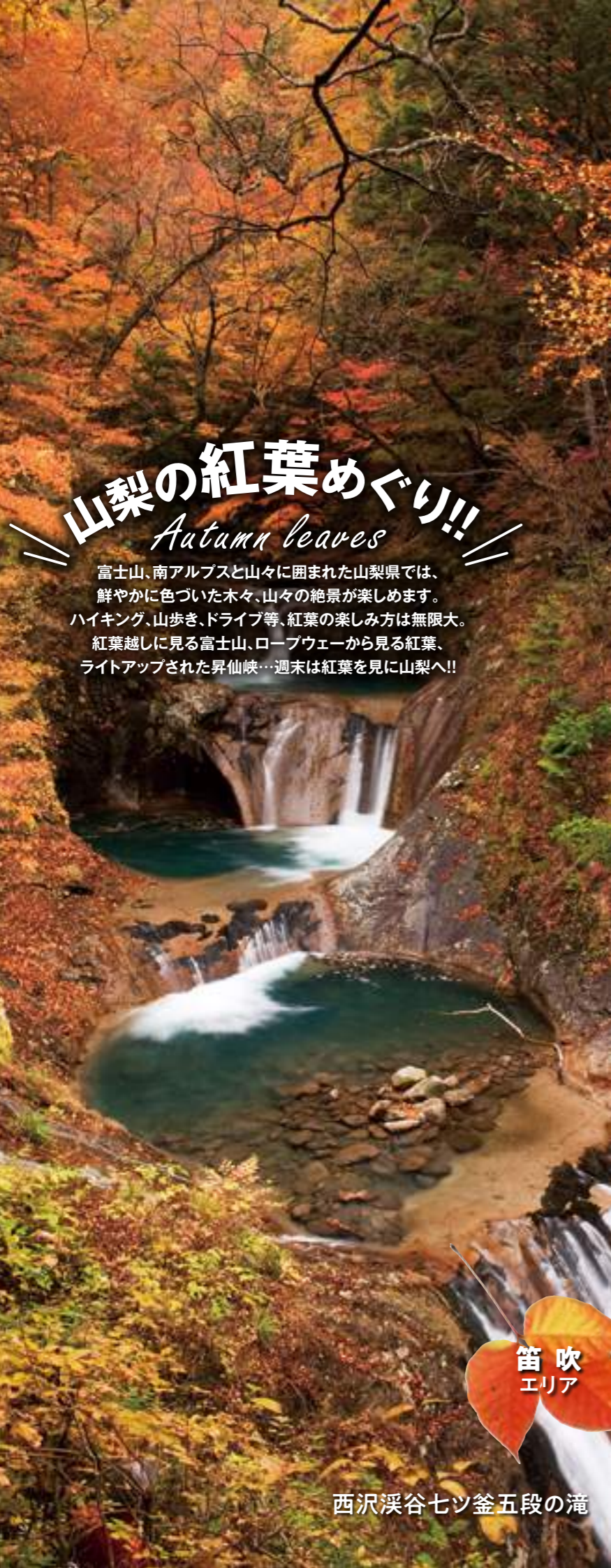
西沢渓谷七ツ釜五段の滝

富士山、南アルプスと山々に囲まれた山梨県では、鮮やかに色づいた木々、山々の絶景が楽しめます。ハイキング、山歩き、ドライブ等、紅葉の楽しみ方は無限大。紅葉越しに見る富士山、ロープウェイから見る紅葉、ライトアップされた昇仙峡…週末は紅葉を見に山梨へ!!