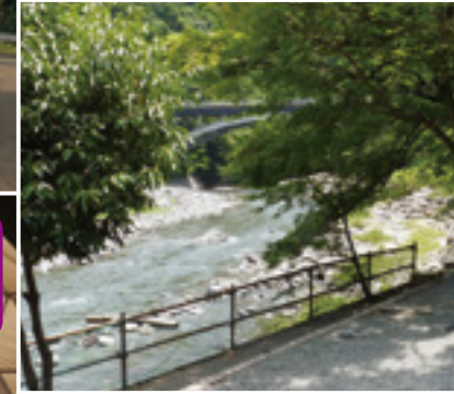
戸沢センター (富士河口湖町)

湖畔キャンプ場 ボートや釣りが楽しめる、富士山を眺めながらのキャンプも山梨ならではの魅力。