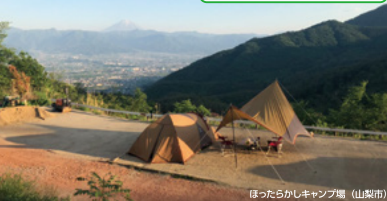
ほったらかしキャンプ場 (山梨市)