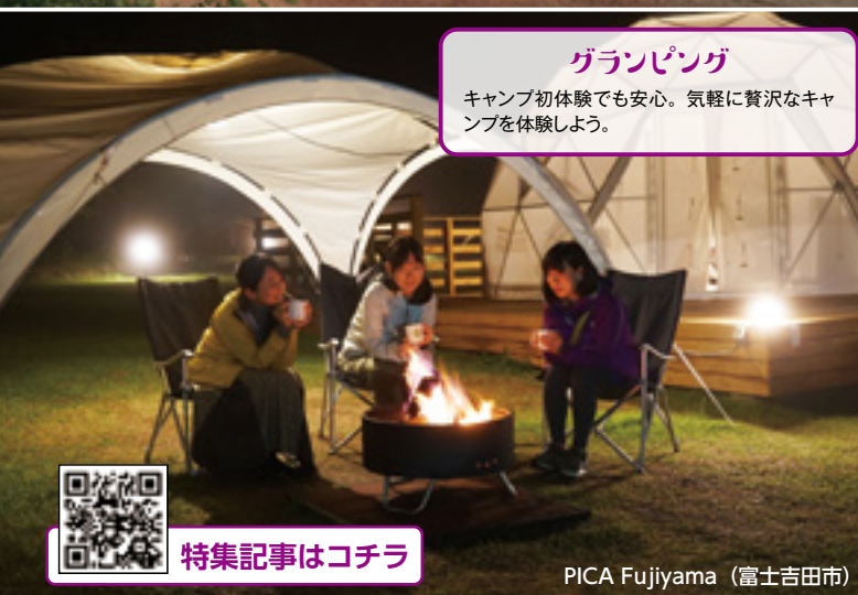
PICA Fujiyama (富士吉田市)