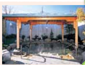
ハケ岳、甲斐駒ヶ岳、瑞牆山…。 雄大な山々に抱かれ、名水の里として も知られたハケ岳エリアは、自然 と一体になった温泉が魅力。多くの 美術館なども点在し、アートの香りが 漂います。