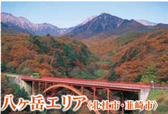
ハケ岳エリア 〈北杜市・韮崎市〉