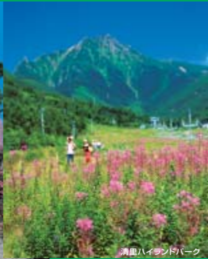
清里ハイランドパーク