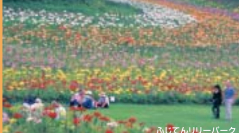
ふじてんリリーパーク