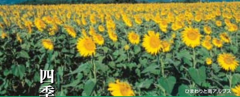
ひまわりと南アルプス