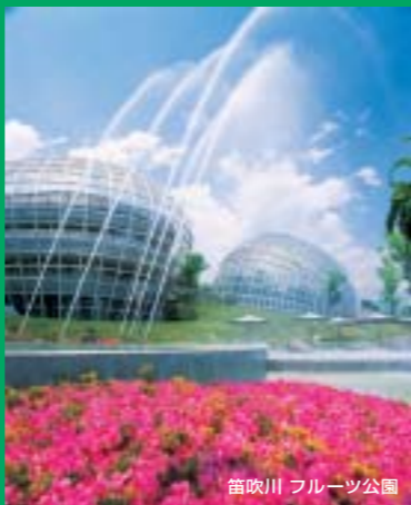
笛吹川 フルーツ公園