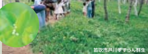
笛吹市芦川すずらん群生