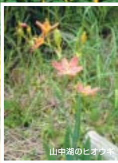
山中湖のヒオウギ