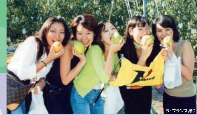
ラ・フランス狩り