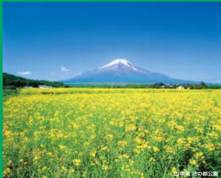
山中湖 花の都公園