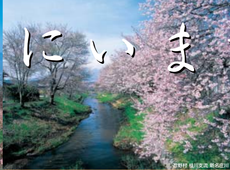
忍野村 桂川支流 新名庄川