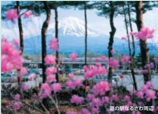
道の駅なるさわ周辺

レンゲツツジ大群落は山の頂きを深紅に染めます。山頂近くまで車で乗り入れ可能。駐車場から20分ほど遊歩道を登ると着きます。 ●JR韮崎駅タクシー 50分 ●15万株 ●6月中旬～7月上旬 ●韮崎市商工観光課 TEL.0551(22)1111