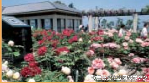
歌舞伎文化公園のホタン