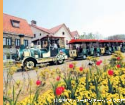
山梨県フラワーセンター・ハイジの村