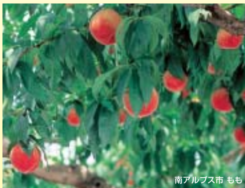
南アルプス市 もも