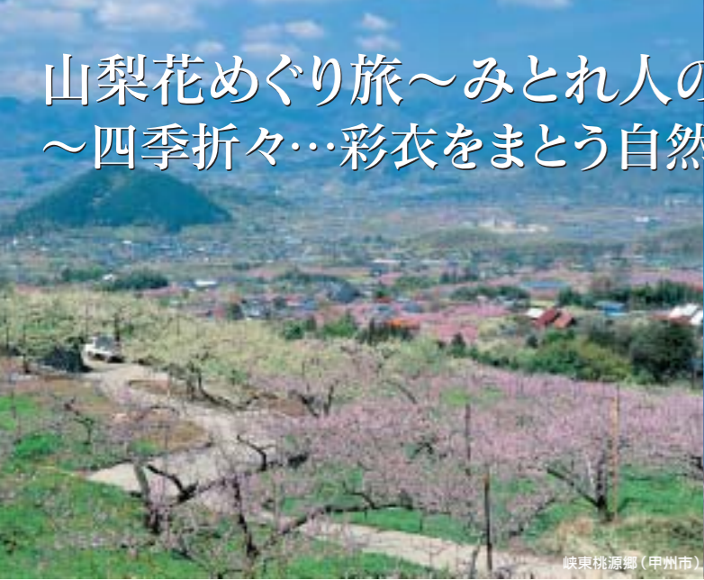
峡東桃源郷（甲州市）