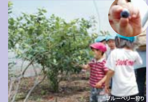
ブルーベリー狩り