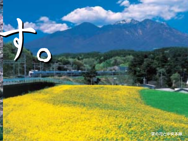
菜の花と中央本線