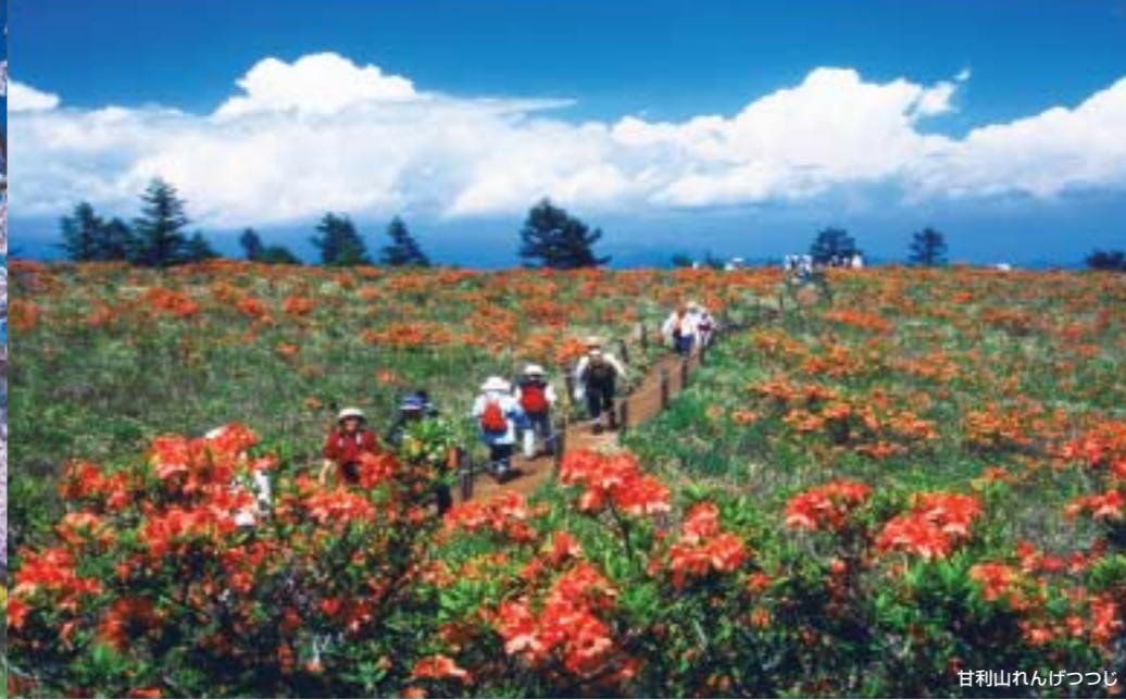
甘利山れんげつつじ