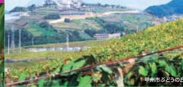
甲州市ぶどうの丘