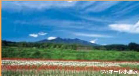
フィオーレ小淵沢

富士山をバックに70種類のゆりが咲きます。関東最大の規模のゆり園。夢のような世界をゴンドラに乗り空中散歩。標高1,300メートルの高原でさわやかな風を感じませんか。 ●河口湖駅シャトルバス30分 中央自動車道河口湖IC車15分 ●70種類・600万輪 ●7月中旬～8月下旬 ●ふじてんリゾート TEL.0555(85)2000