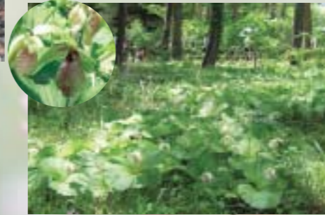
山中湖のクマガイ草群生