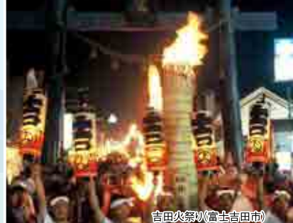
吉田火祭り(富士吉田市)