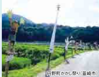
円野町かかし祭り(韮崎市)