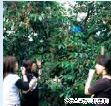
さくらんぼ祭り(甲斐市)