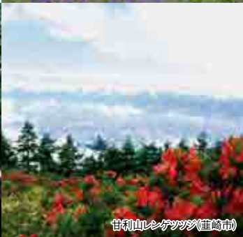
甘利山レネッサンス(韮崎市)