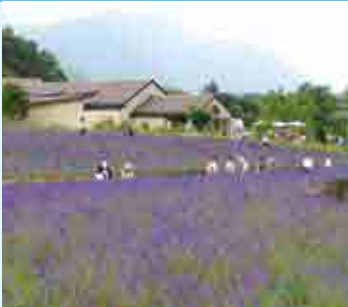
河口湖ハーフフェスティバル(富士河口湖町)

6月下旬から7月上旬にかけて、見事な杉林に抱かれた妙法寺境内には、約2万株のあじさいが咲き誇り、本堂を華やかに彩り「あじさい祭り」を開催。 小室山妙法寺 JR身延線御所駅→タクシー約15分 / 中部横断自動車道 増穂IC→約15分 0556-22-7202(富士川町商工観光課)