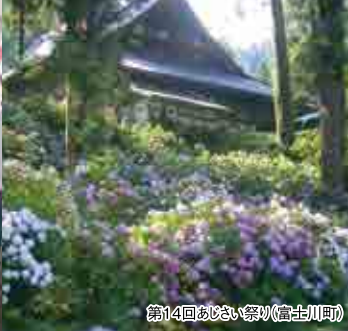
第14回あじさい祭り(富士川町)