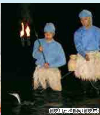
笛吹川石和鵜飼(笛吹市)