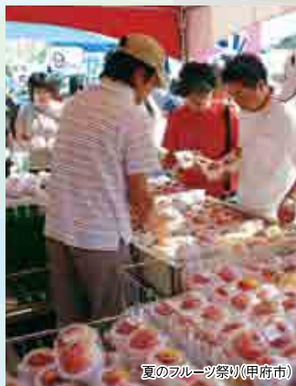
夏のフルーツ祭り(甲府市)

30日の夜には駅前中央通りに露店が並び、神輿や和太鼓の演奏、神楽が奉納されます。若宮八幡宮で「茅の輪くぐり」の伝統行事を開催。 若宮八幡宮 JR中央本線韮崎駅→徒歩約10分 / 中央自動車道 韮崎IC→約10分 例祭:0551-22-1727(若宮八幡宮) みこしまつり:0551-22-2204(韮崎市商工会)