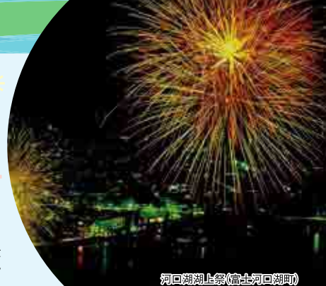
河口湖湖上祭(富士河口湖町)

*掲載のイベント情報は、内容が変更となる場合がありますのでお出かけの際は事前にご確認ください。 *1 交通規制、駐車場規制のため県営船津浜・平浜駐車場は利用できません。周辺の臨時駐車場(無料)をご利用ください。 *2 富士吉田駅は7/1より富士山駅に駅名変更。