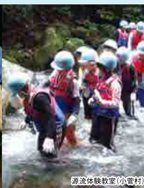
源流体験教室(小菅村)