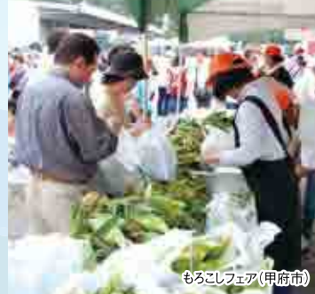
もろこしフェア(甲府市)