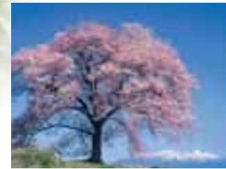
韮崎・ワニ塚の桜

雄大な南アルプス・八ヶ岳・甲斐駒ヶ岳等の山々を背景に咲き誇る、四季折々の花。雨が少なく日照時間が長い肥沃な大地に、おとぎ噺のような美しい風景が広がります。山梨屈指の農産地でもあり、新鮮な旬の味覚が楽しめるのも大きな魅力。点在する直売所には、採れたての野菜や果物が所狭しと並んでいます。豊富なラジウム含有量で人気の増富ラジウム温泉を始め、健康増進をテーマにした温泉も多いこのエリア。立地を活かした見事な眺望や多彩な施設、泉質の多様性も高い人気の理由です。散策やドライブの途中にも、ぜひお立ち寄り下さい。