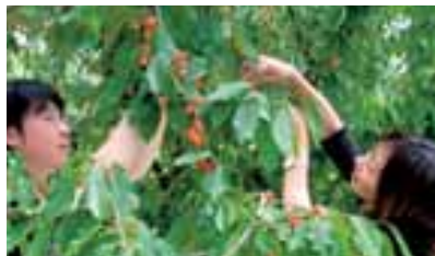
さくらんぼ狩り (5月上旬～7月上旬)

標高800m、南アルプス連峰に囲まれた山深い渓谷に湧く西山温泉は、707年開湯という日本有数の古湯。2005年には51.5℃の温泉が毎分1630Lも湧出する新湯が登場し、新たな歴史を刻んでいます。大自然が織り成す渓谷美の中、自然湧出の温泉をたっぷり楽しめる秘湯中の秘湯です。