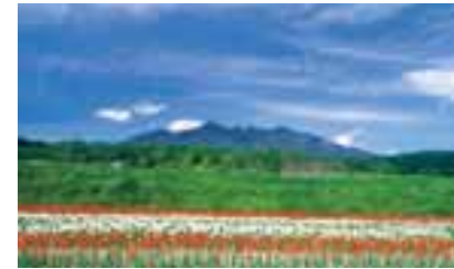
北杜市小淵沢・フィオーレ小淵沢