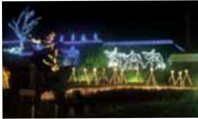
甲府・光のピュシス(12月~1月中旬)