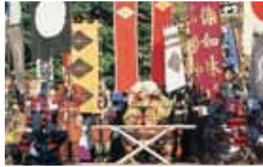
甲府・信玄公祭り(4月上旬)