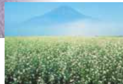
富士河口湖町・ラベンダー

日本を代表するリゾートスポットとして、多くの人々が訪れる富士山麓は、絶景の湯の宝庫。宿によっては、富士山の雄姿や、湖面に映える逆さ富士を眺めながら入浴するという、最高の贅沢が味わえます。例年8月1日から5日にかけて5つの湖で順に開催される盛大な花火大会を筆頭に、華やかなイベントも目白押し。冬花火や華麗なイルミネーションが湖畔を飾る、冬の富士五湖にも注目です。