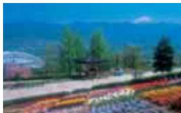
笛吹川フルーツ公園