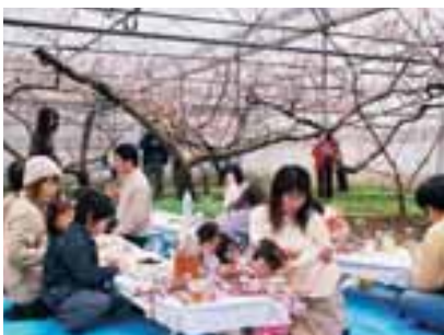
笛吹市石和・ハウス桃の花見 (2月11日～3月中旬)

■桃のハウスで、一足早い春を満喫 2月11日～3月中旬、まだ肌寒い桃源郷に、一足早い春の訪れを告げる新たな風物詩が、桃のハウスでのお花見。温かいハウスの中、色鮮やかに咲き誇る桃の花を間近に眺めながら、友人や家族と過ごす楽しいひとときは、希望の春を予感させる不思議な魅力で溢れています。