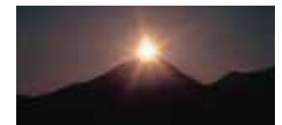
ダイヤモンド富士 (冬至頃～1月上旬)

湯の町情緒が色濃く残る下部温泉郷は、県内各地に伝わる「信玄の隠し湯」の代表格。古くから、骨折や打身、切傷に効能が高いと言われ、信玄公自身も川中島の合戦での負傷を癒したとか。温泉医学に通じた温泉療法医*が選ぶ「名湯百選」にも選ばれた湯を求め、現在も多くのアスリートが訪れます。