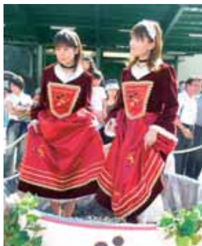
ワイナリー収穫祭