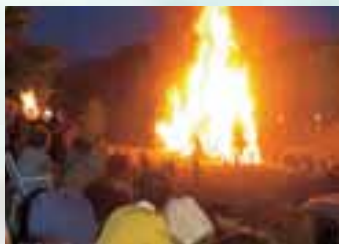
小菅村・多摩源流祭り(4月下旬)

往時の繁栄を偲ばせる甲州街道が、400年の時を経て、古き良き時代を今に伝える大月市。古人のロマンたどよう歴史の街の周囲には、緑豊かな大自然が広がります。小菅や道志の壮大な渓谷美に季節の移ろいを感じ、首都圏の水瓶・多摩川の源流の清らかな流れに耳を澄ませていると、心が満ちてくるのかわかります。大自然の息吹を感じつつ、童心に戻って子どもと水遊びに興じたり、山歩きに繰り出すのも、この地ならではの楽しみ方。一日の終わりには、肌がツルツルスベスベになると評判の美人の湯にゆっくりと浸り、大自然の恵みを楽しむと、明日への活力がみなぎります。