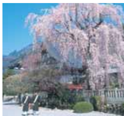
身延山久遠寺のしだれ桜

富士山頂に太陽が重なる瞬間、凹凸の地形を通して現れるダイヤモンドの光彩。自然が創造する瞬間芸術=ダイヤモンド富士の圧倒的な美は、人々の心を魅了します。冬至～1月上旬、澄みきった空気の中でひとときわ輝くダイヤモンド富士を楽しめる増穂町高下地区は、元旦にダイヤモンド富士の初日の出が拝めます。