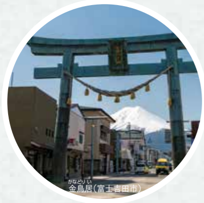
のぼる 金鳥居(富士吉田市)

壮麗で神聖な山容が「信仰の対象」と「芸術の源泉」として認められ、世界文化遺産として登録された富士山。その価値を証明する25の構成資産から、テーマに関連する構成資産を選んで専門ガイドの解説付きで案内する、人気の高いツアーです。