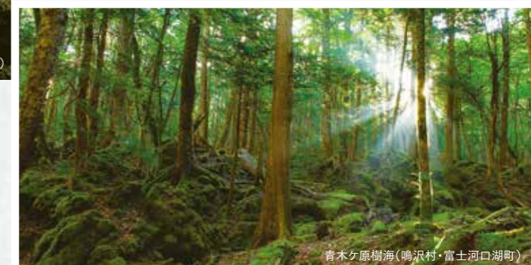
青木ヶ原樹海(鳴沢村・富士河口湖町)

約1300年前の富士山の噴火で流れ出した溶岩の上に形成された青木ヶ原樹海。原始の森を彷彿とさせる神秘的な風景や、畏敬の念を感じさせる『溶岩洞窟』など、他では味わうことのできないおもしろさやスリルを体験できます。