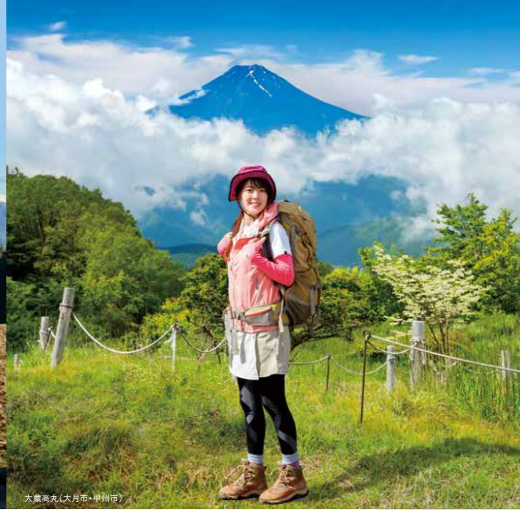
大蔵高丸(大月市・甲州市)