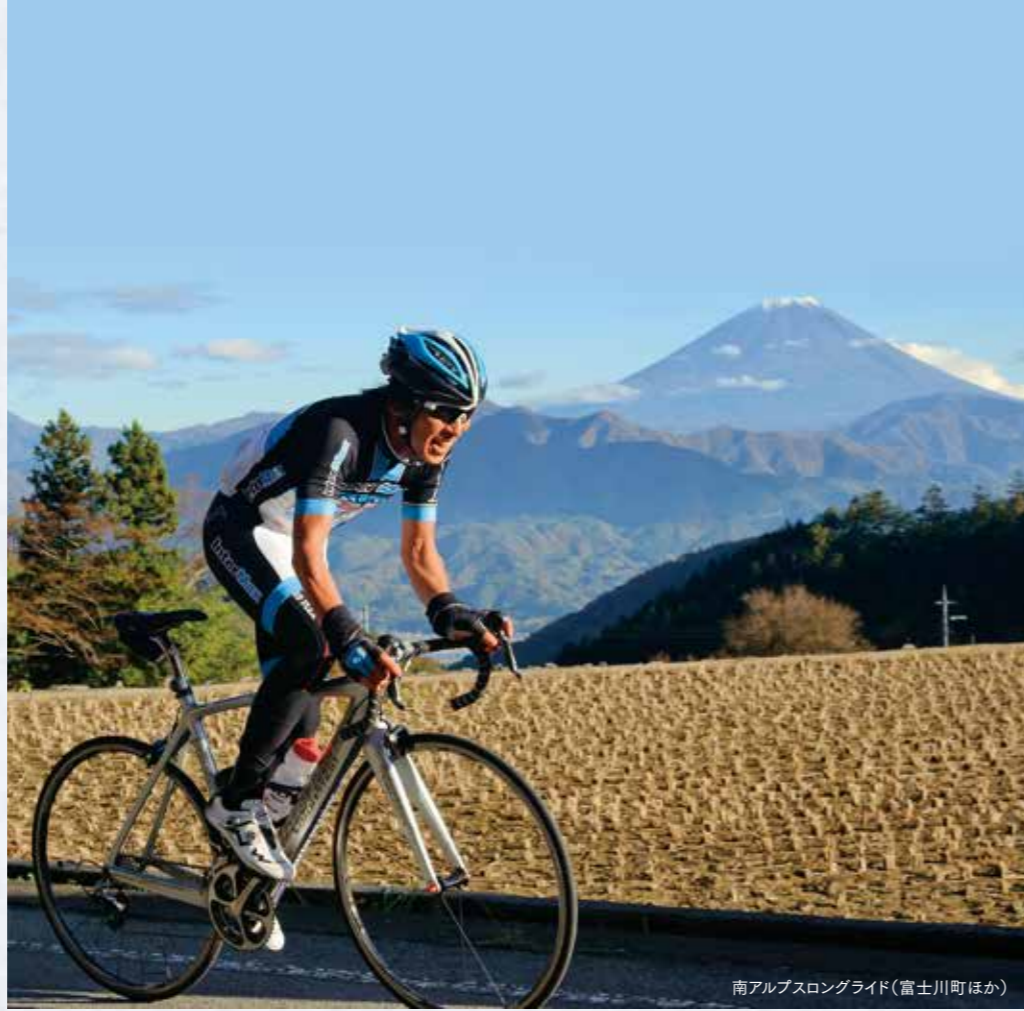
南アルプスロングライド(富士川町ほか)