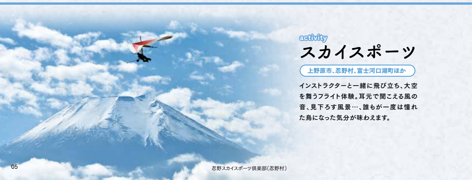
忍野スカイスポーツ倶楽部(忍野村)