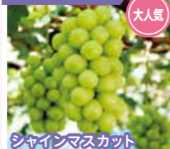
シャインマスカット