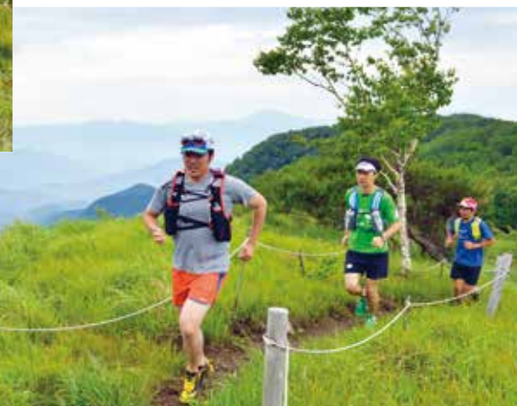
大蔵高丸(大月市・甲州市)

名だたる日本の名峰から、初心者でも気軽に楽しめる里山まで、バラエティに富んだトレッキングコース。季節の花や富士山の絶景など、見どころ楽しみどころもいっぱいです。