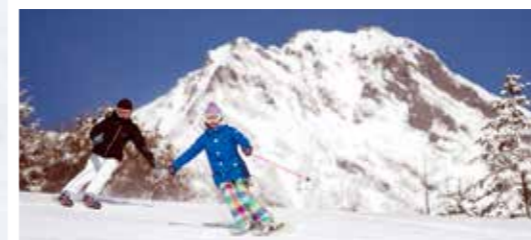
サンメドウズ清里スキー場(北杜市)

2020年東京オリンピックの正式種目に決定し、急速に人気が高まっているボルダリングを、県内5か所のジムで気軽に楽しめます。