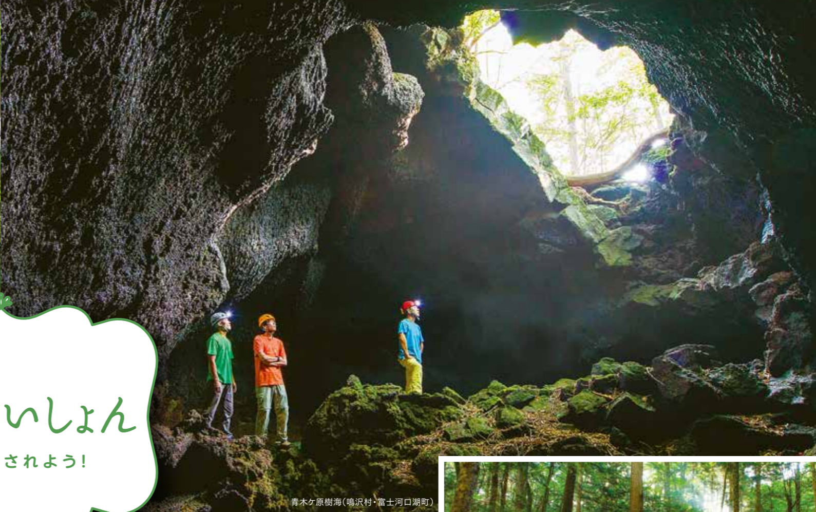
青木ヶ原樹海(鳴沢村・富士河口湖町)