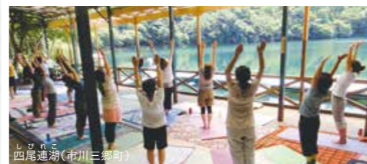
四尾連湖(市川三郷町)