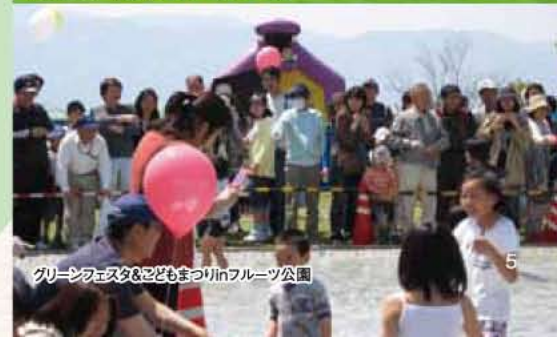
グリーンフェスタ&こどもまつりinフルーツ公園