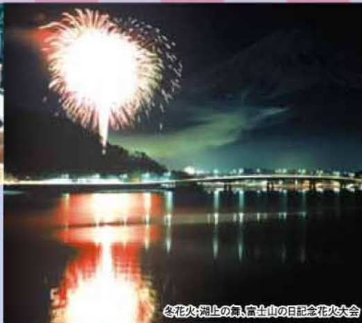
冬花火・湖上の舞、富士山の日記念花火大会