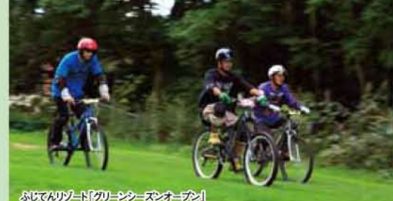
ふじてんリゾート「グリーンシーズンオープン」