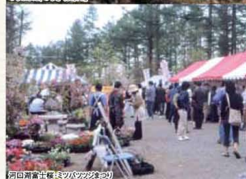
河口湖富士桜・ミツバツツまつり