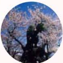
やまたかじん たいげに 山高神代桜 北州市