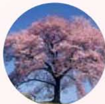
わに塚のサクラ 韮崎市

■JR中央本線日野春駅→タクシー約15分/中央自動車道 須玉IC→約15分 ■0551-42-1414(北州市観光協会)