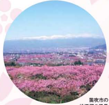
笛吹市の桃源郷の風景

¥500円(ジュース付)で持ち込み自由 ■笛吹市内桃園 ■JR中央本線石和温泉駅→タクシー約20分/ 中央自動車道 甲府南IC→約15分 ■【開催前】055-262-2158、 【開催中】055-262-3853(JAふえぶき富士見支所直売所)