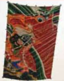
甲州風上げまつり

夜のワイン蔵めぐりで、ワイン職人自らが説明してくれます。その後は、夜の桃の花見。ライトアップされた桃の花は、昼とはまた違う美しさです。 笛吹市・甲州市内 JR中央本線石和温泉駅→徒歩約20分 055-262-3626(石和温泉旅館協同組合)