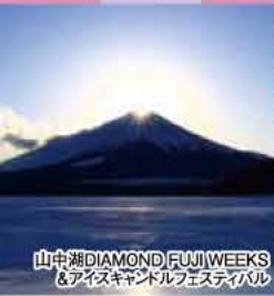
山中湖DIAMOND FUJI WEEKS & アイスキャンドルフェスティバル