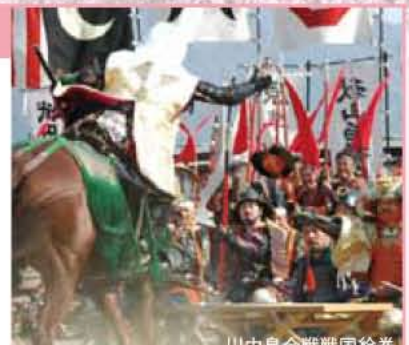
川中島合戦戦国絵巻

■笛吹市役所前笛吹川河川敷 ■JR中央本線石和温泉駅→徒歩20分/中央自動車道 一宮御坂IC→約15分 ■055-261-2829(笛吹市観光物産連盟)