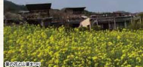
菜の花と山菜まつり

■勝山ふれあいセンター「さくやホール」 ■富士急行線河口湖駅→タクシー約10分/中央自動車道 河口湖IC→約15分 ■0555-72-5588(富士河口湖町教育委員会文化振興局)