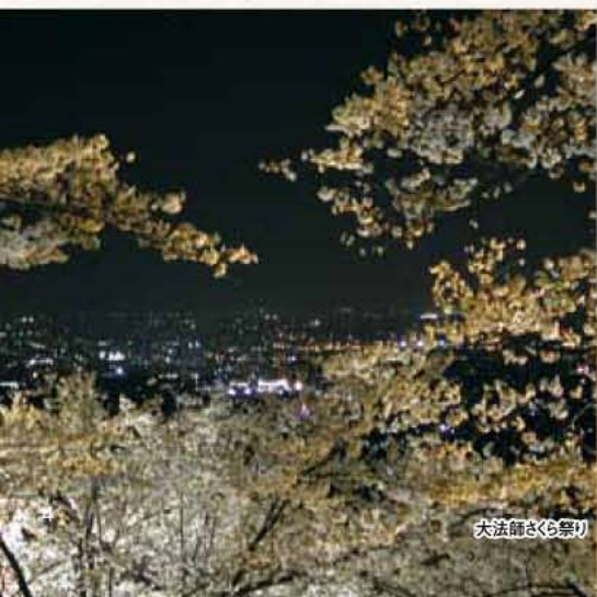
大法師さくら祭り