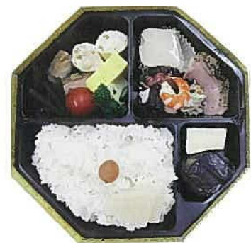
森林セラピー弁当