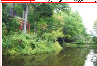
<出口池> 世界文化遺産の忍野八海の1つ。