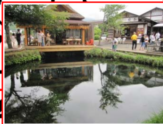
＜湧池＞ 世界文化遺産の忍野八海の1つ。