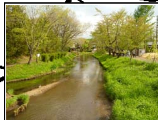
＜新名庄川＞ 豊かな水がゆらゆらと流れる新名庄川。のんびりてくてく歩いても、気持ちがいいです。