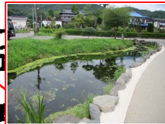
＜鏡池＞ 世界文化遺産の忍野八海の1つ。