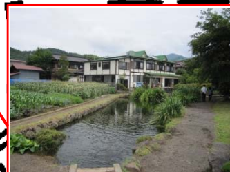
＜菖蒲池＞ 世界文化遺産の忍野八海の1つ。