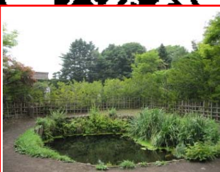
＜銚子池＞ 世界文化遺産の忍野八海の1つ。