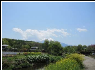
＜新名庄川＞ 豊かな水がゆらゆらと流れる新名庄川。その先に富士山がのぞめ、とっても絵になる構図です。