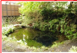
＜釜池＞ 世界文化遺産の忍野八海の1つ。