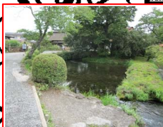
＜濁池＞ 世界文化遺産の忍野八海の1つ。