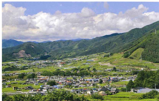
山梨県でも最も多くのワイナリーが地域内に集積しているのが甲州市勝沼町。どこを歩いてもブドウ畑が広がる。