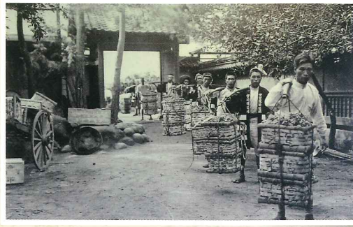
山梨では明治時代からワインが造られていた。

山梨県は日本におけるワイン醸造発祥の地。その歴史は明治時代にまでさかのぼる。最初にワインが醸造されたのは明治3年。なんと、明治10年には本場のワイン造りを学ぶため青年2人をフランスに留学させている(244ページ「山梨県ワイン産業の発達史」参照)。