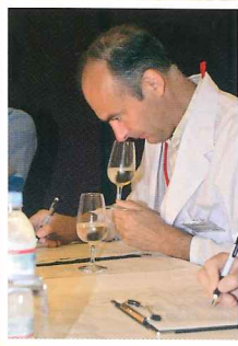
審査は外国人を含む25名で行う。

受賞ワインは世界の在外公館の公式行事などに提供され、海外における日本ワインの認知度を高めるのに一役買っている。